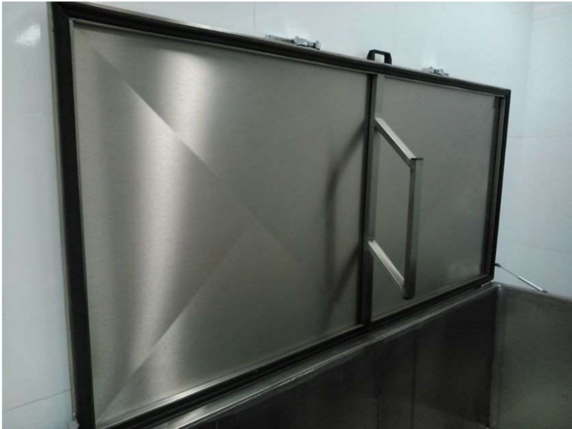
FIGURA 7 - TAMPA ÚNICA COM SISTEMA DE VEDAÇÃO POR TRAVAS COM BOLA DE TRAVAMENTO (TIPO CÂMARA FRIGORÍFICA) E GAXETA PARA VEDAÇÃO, COM PUXADOR CENTRAL.