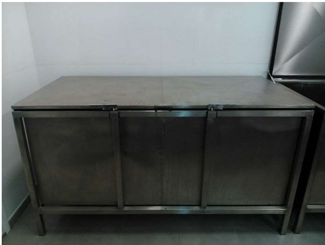
FIGURA 7 - TAMPA ÚNICA COM SISTEMA DE VEDAÇÃO POR TRAVAS COM BOLA DE TRAVAMENTO (TIPO CÂMARA FRIGORÍFICA) E GAXETA PARA VEDAÇÃO, COM PUXADOR CENTRAL.