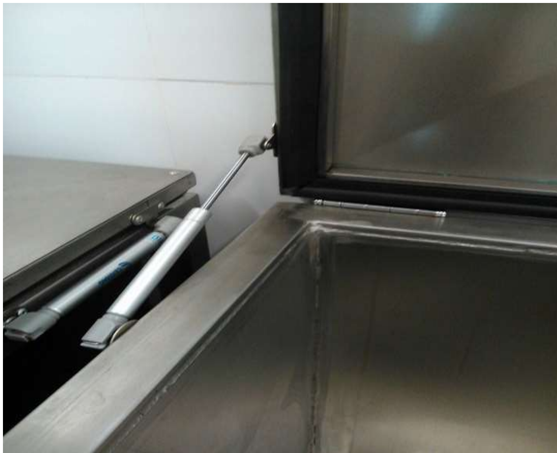
FIGURA 4 - CILINDROS HIDRÁULICOS LATERAIS (TIPO LEVANTAMENTO AUTOMÁTICO) PARA A TAMPA, UM EM CADA LADO DO TANQUE, PROPORCIONANDO DIMINUIÇÃO DA FORÇA GRAVITACIONAL DURANTE A ABERTURA E FECHAMENTO DO TANQUE.