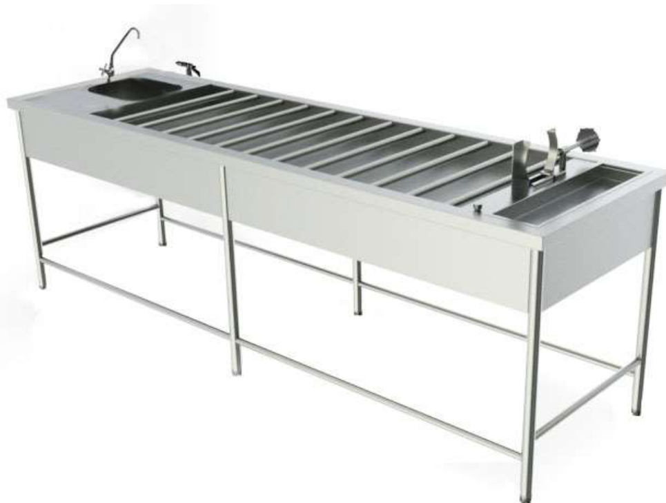
FIGURA 9 - MESA PARA NECROPSIA CONFECCIONADA TOTALMENTE EM AÇO INOXIDÁVEL (NO PADRÃO AISI 304, LIGA 18.8) PARA REALIZAÇÃO DE NECROPSIA, DISSECAÇÃO, CONSERVAÇÃO E LAVAGEM DE CADÁVERES E PEÇAS CADAVÉRICAS.