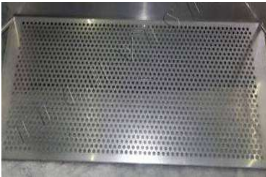
FIGURA 3 - PRATELEIRAS/GRELHAS INTERNAS PARA ELEVAÇÃO DE CADÁVERES E TRAVA, COM ESPESSURA REFORÇADA NECESSÁRIA PARA SUPORTAR 500KG, POSSUINDO SISTEMA DE ELEVAÇÃO POR PRESSÃO HIDRÁULICA, ANEXADO AO TANQUE, QUE PERMITAM O ESCOAMENTO DO FORMOL E A ELEVAÇÃO UNIFORME DAS PRATELEIRAS/GRELHAS.