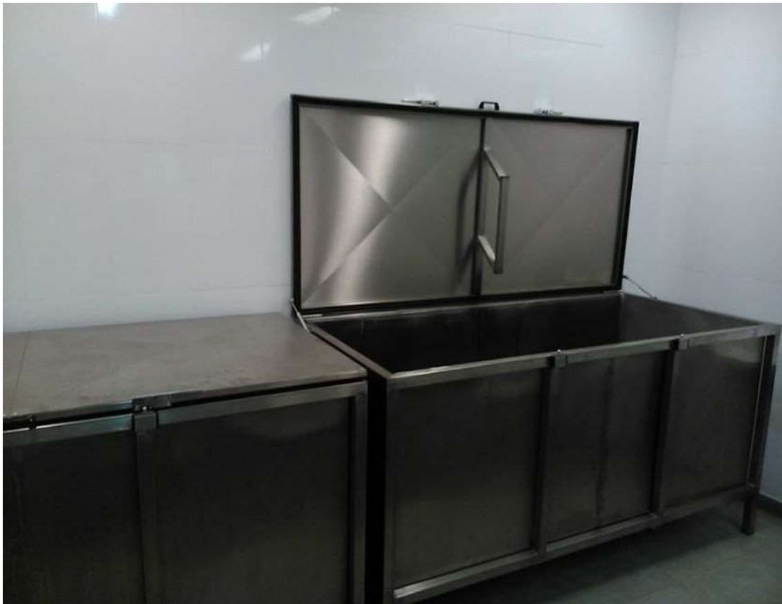
FIGURA 5 - AÇÃO DO CILINDRO HIDRÁULICO.